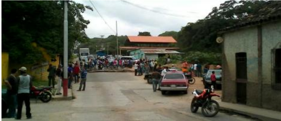
Vecinos del Eneal minutos antes de ser dispersados